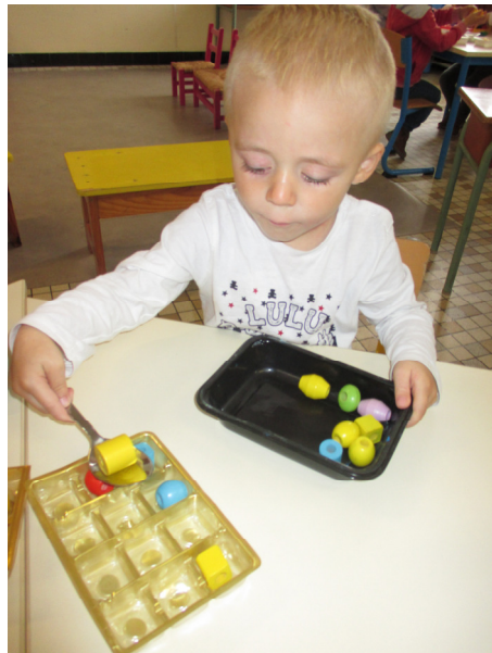
Je transvase les perles à l'aide de la grande cuillère, sans les faire tomber ni les toucher, d'un récipient à l'autre.