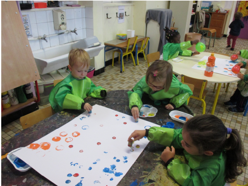
Je laisse des traces avec les bouchons et le ballon de baudruche.