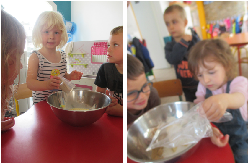
Lundi, nous avons cuisiné des cookies !