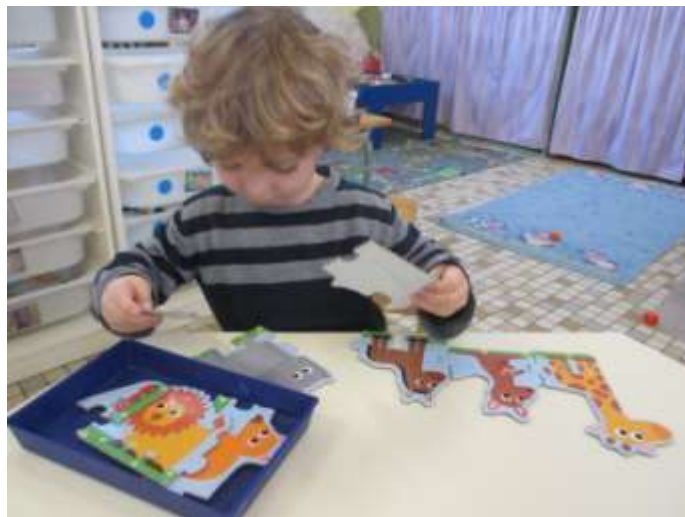
Je range les animaux selon leur taille : du plus grand au plus petit.