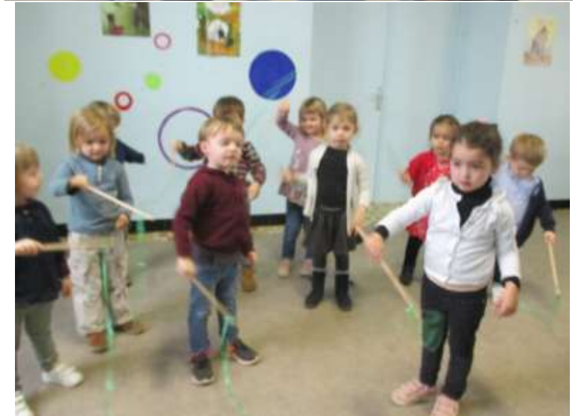
ROND : Je forme des rondes collectives, par 2 (Gugus, Dansons la capucine, Mon petit lapin...). Je travaille le geste circulaire avec un ruban.