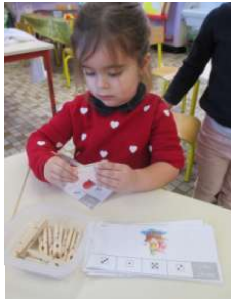
Je dénombre les objets et j'associe la représentation-dé.