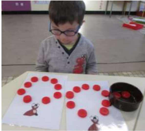
Je forme des ronds avec les bouchons.