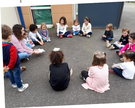
Puzzles des instruments

Depuis la semaine dernière, l'après-midi, nous travaillons avec les élèves de CP - CE 1 pour créer ensemble des instruments de musique qui seront installés prochainement dans la cour.