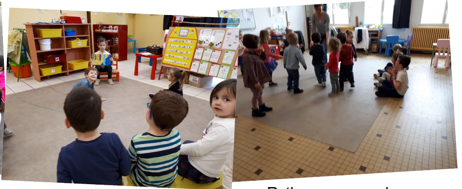
Lecture sur la musique