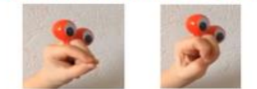
Bien positionner ses doigts, fléchir l'index et le majeur

» » »Une histoire pour apprendre à bien tenir le crayon » » »