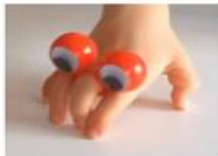
Bien délier ses doigts