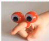
Bien bouger l'index