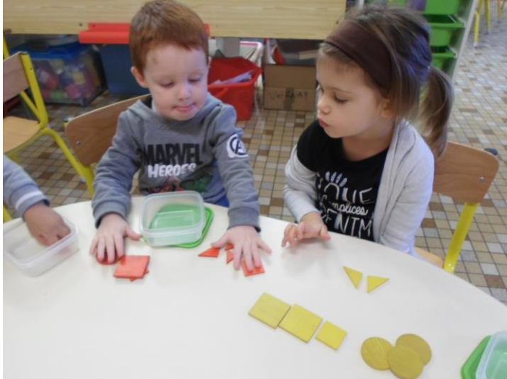
Atelier 1 : Nous trions par formes.