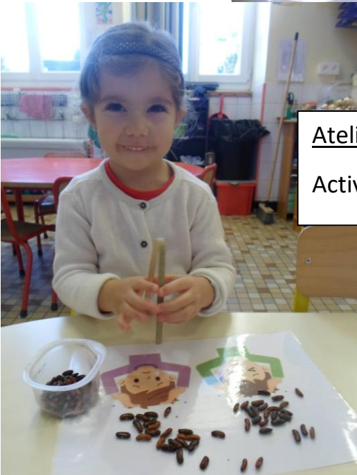
Atelier autonome : Activité Pince