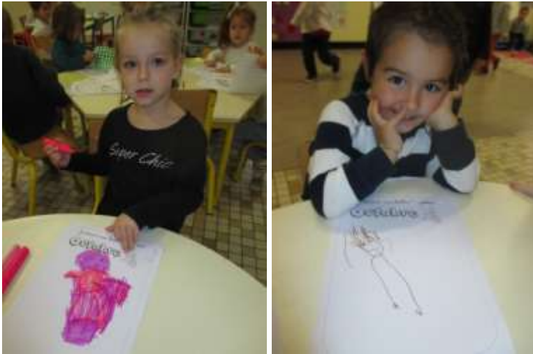
Je dessine mon premier bonhomme.