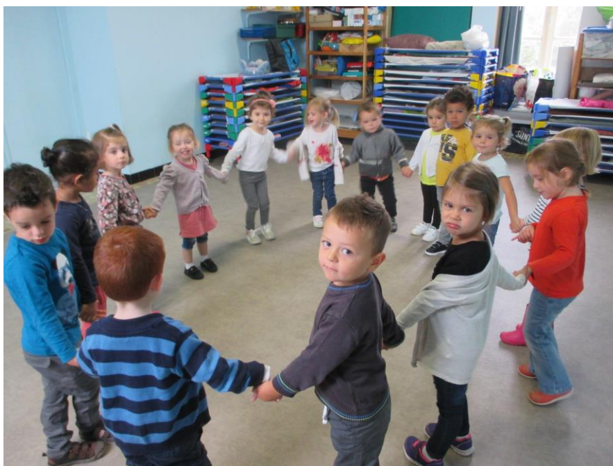
La ronde des prénoms