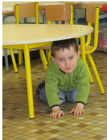
« SOUS »