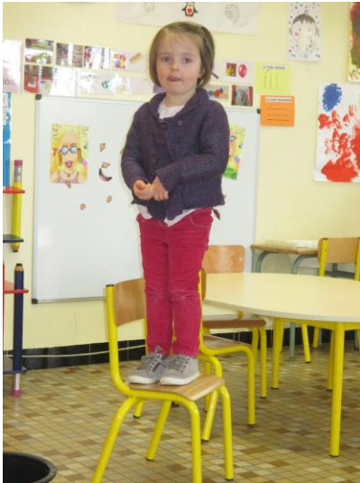
« SUR »