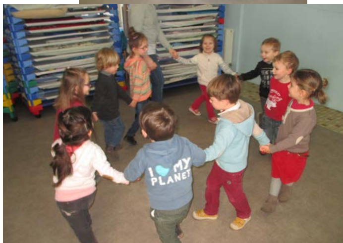
La danse des esquimaux.

Nous poursuivons la réalisation des cadres sur le thème de la banquise.