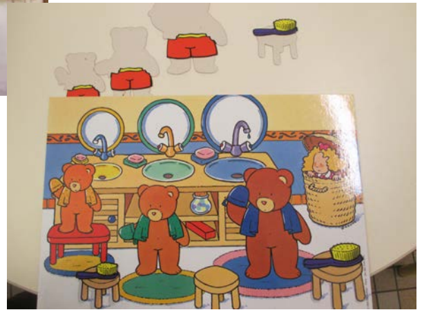
Le jeu des trois ours.

En motricité, nous jouons au jeu des microbes :