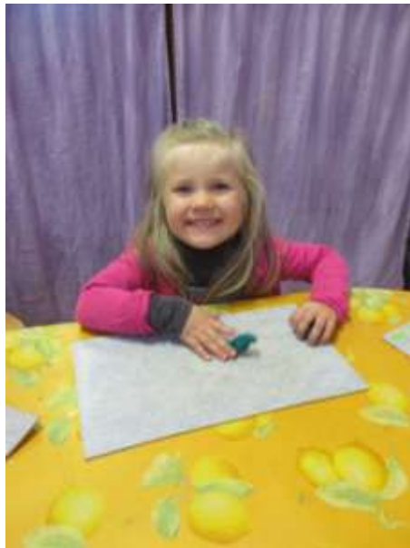
Je forme des boules en pâte à modeler.