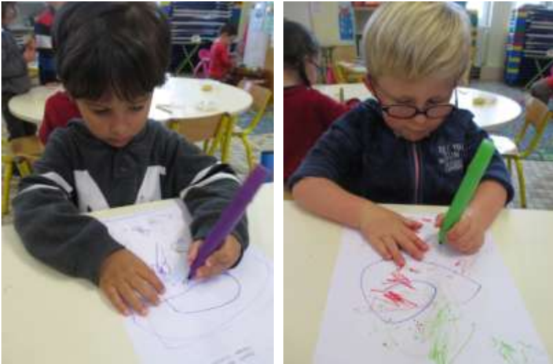
Je représente un bonhomme.