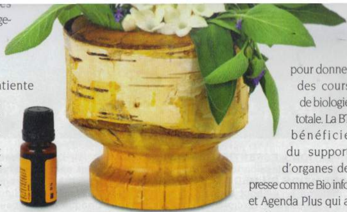
▲ Parmi les traitements recommandés par Geerd Hamer, chef de file de la biologie totale, figure notamment l'aromathérapie...

Un autre procès très médiatisé contre la BT a été mené suite à la plainte de la fille de Jacqueline Starck, décédée en 2007 d'un cancer du sein vraisemblablement curable. Trois « praticiens » sont dans le collimateur : une