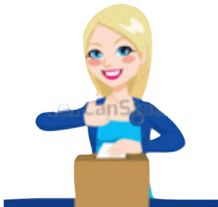
ETRE UNE FEMME