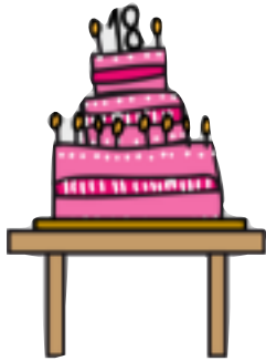
LES PERSONNES DE PLUS DE 18 ANS

Quelles sont les trois conditions pour voter ? Découpe la bonne image et colle la dans ton exercice.