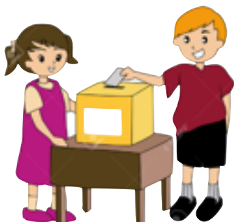
ETRE UN ENFANT