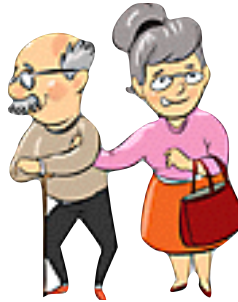
AVOIR PLUS DE 60 ANS