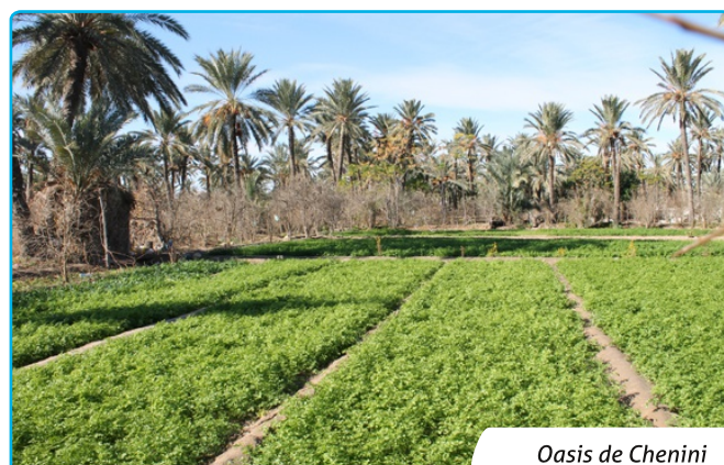
Oasis de Chenini

Propos recueillis par Noura Belguasem, Volontaire RADD0 pour ASOC asoc@planet.tn