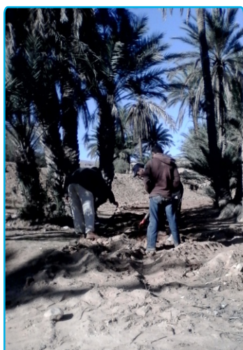
Oasis de Ksar El Hallouf en Tunisie

Propos recueillis par Noura Belguasem, Volontaire RADDO pour ASOC asoc@planet.tn