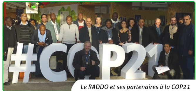
Le RADDO et ses partenaires à la COP21

L'année 2015 aura vu l'émergence de nouvelles initiatives multi-acteurs rappelant ainsi que les oasis ne sont pas uniquement l'affaire des oasiens, mais bien de tous. C'est d'ailleurs ce "nous" imposé par les différentes projections sociales, économiques ou encore environnementales, qui s'est un peu plus exprimé à travers les 195 gouvernements ayant participé à la COP12 à Ankara et à la COP21 à Paris, où le RADDO était présent. Dors et déjà, les oasis suscitent un