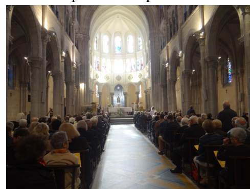
Jour de Pâques