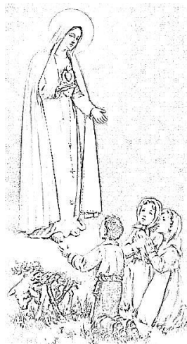
Notre Dame de Fatima avec François, Jacinthe et Lucie.