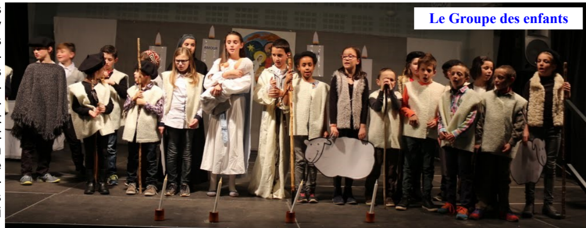
Le Groupe des enfants

Et cette lumière est venue dans notre monde il y a 2000 ans sous la forme d'un petit enfant dans une crèche. Ainsi, dans le second conte, c'est en cherchant Noiraud, son agneau égaré que le petit berger errant dans les ténèbres a fini