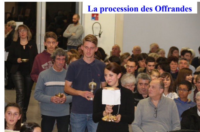
La procession des Offrandes

par découvrir ses amis rassemblés près de la vraie lumière. Cette lumière est pour tous – donc un grand merci aux enfants de nous l'avoir chanté joyeusement accompagnés à la guitare « Aujourd'hui s'est levé la lumière, c'est la lumière du Seigneur. Elle dépassera les frontières, elle habitera tous les cœurs ». Cette lumière éternelle demeure aussi au centre du magnifique tableau de la Nativité que nous avons pu admirer et où une artiste de Bosdarros a exprimé tout son talent.