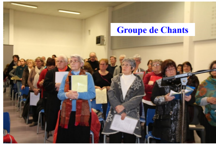
Groupe de Chants

par découvrir ses amis rassemblés près de la vraie lumière. Cette lumière est pour tous – donc un grand merci aux enfants de nous l'avoir chanté joyeusement accompagnés à la guitare « Aujourd'hui s'est levé la lumière, c'est la lumière du Seigneur. Elle dépassera les frontières, elle habitera tous les cœurs ». Cette lumière éternelle demeure aussi au centre du magnifique tableau de la Nativité que nous avons pu admirer et où une artiste de Bosdarros a exprimé tout son talent.