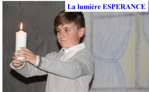
La lumière ESPERANCE

En première partie de soirée, malgré une sonorisation capricieuse, les enfants du catéchisme ont mimé 2 contes sur le thème de la lumière. Du plus loin des âges nous savons qu'elle est synonyme de vie. Mais dans des périodes troublées, d'épreuves ou à certains moments de nos existences, la lumière s'estompe jusqu'à mourir. Ainsi, la lumière de la paix s'éteint sous les conflits permanents, les guerres incessantes ; celle de l'amour cesse de briller quand nos frères ne sont plus nos frères et celle de la foi vacille lorsque la lassitude et le doute s'installent.