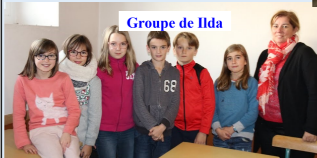
Groupe de Ilda

1ère étape : (re)découverte de l'année liturgique, Avent, Temps de Noël, Carême, temps pascal, temps ordinaire et quelques fêtes importantes pour les chrétiens, comme celle de la TOUSSAINT;