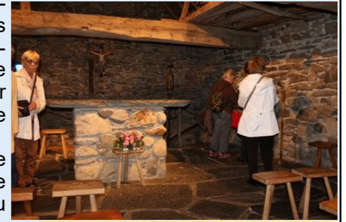
La chapelle de la Cité Saint Pierre