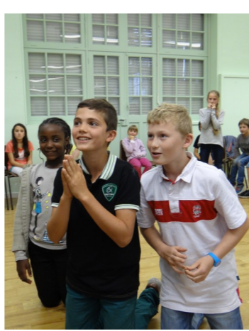
Les enfants du KT fêtent la fin de l'année