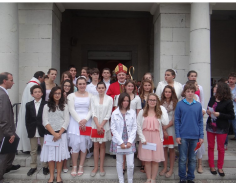
Sacrement de Confirmation