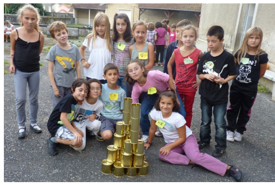
Messe des trois clochers : Chapelle de Rousse