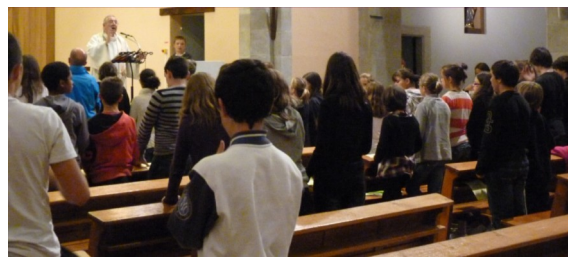
Messe de rentrée des aumôneries