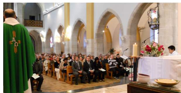
20 ans de jumelage avec Borja