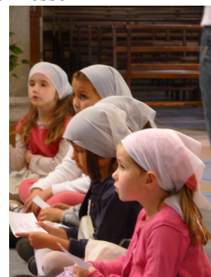
La petite Enfance fête la Toussaint