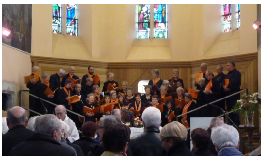
Messe de la Sainte Cécile