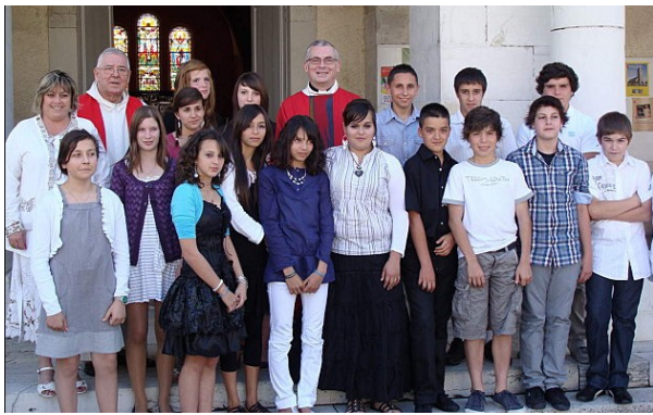
Sacrement de Confirmation