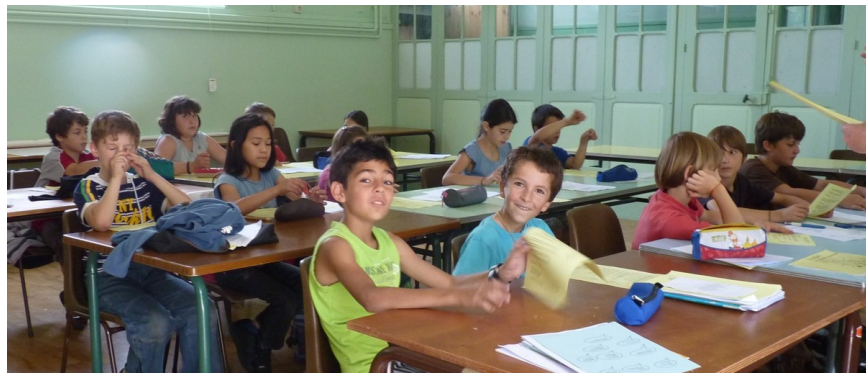
Préparation Première Communion