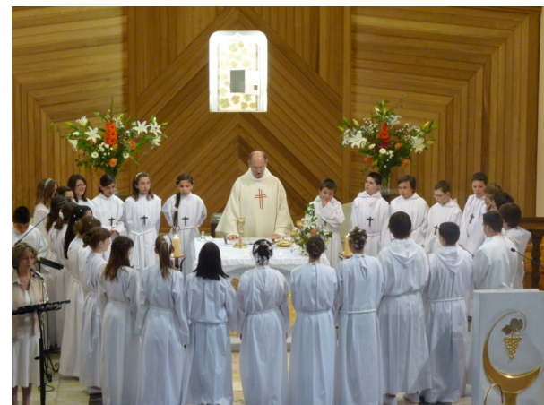
Profession de Foi