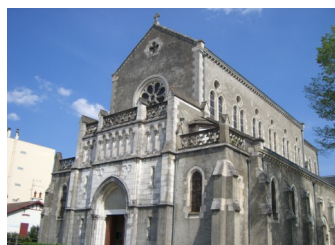
Notre Dame du Bout du Pont