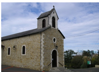
Chapelle de Rouse