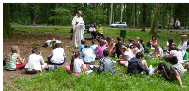
Marche Betharram - Lourdes