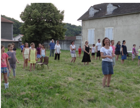
Soirée Olympiades KT