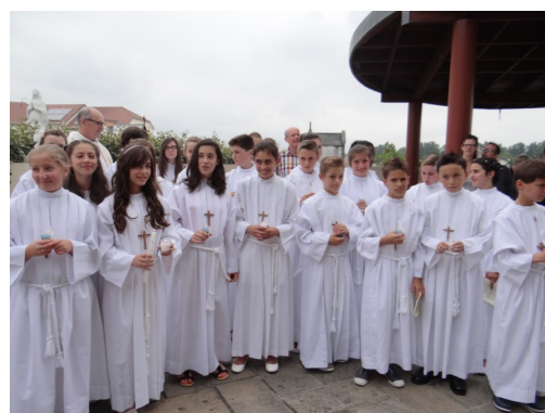
Profession de Foi