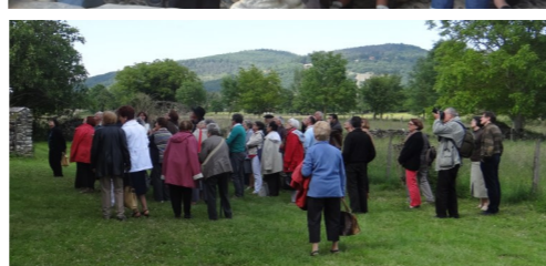
Journée Mondiale de la Communication