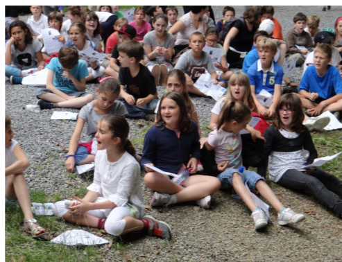
Sortie KT à Bétharram