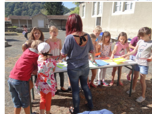
Rentrée du catéchisme