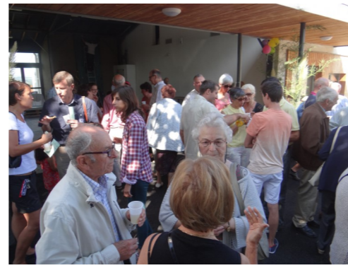
Rentrée paroissiale le 7 septembre 2014 à Chapelle de Rousse