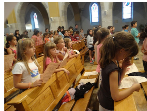
Messe des familles