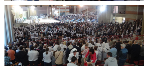
Pèlerinage diocésain à Lourdes