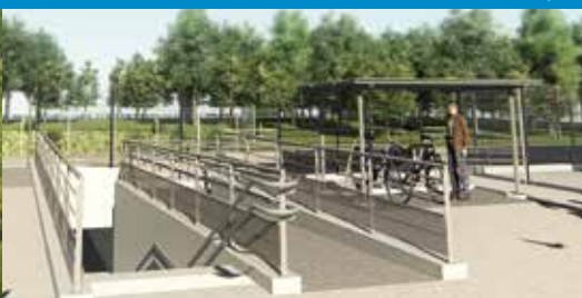
Intentions d'aménagement - Images non contractuelles