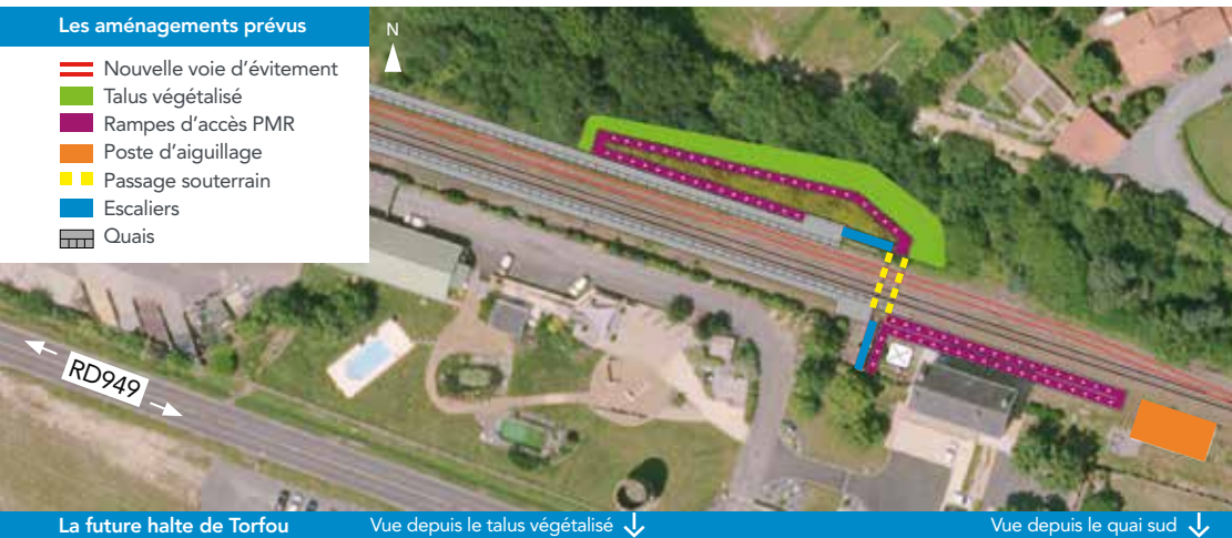
La future halte de Torfou