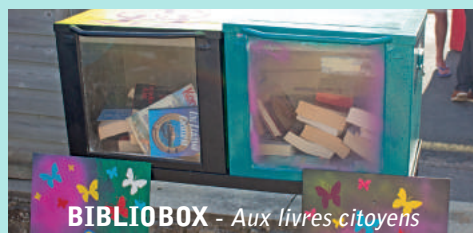
BIBLIBOX - Aux livres citoyens

Cet espace est ouvert à tous, accessible et en libre dépôt ou prêt.