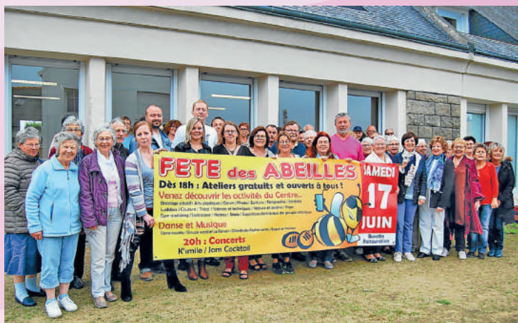
Membres de la commission d'animation, choristes et animateurs