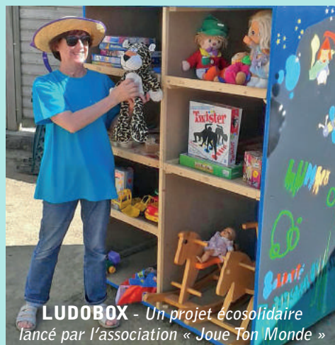
LUDOBX - Un projet ecosolidaire lancé par l'association « Joue Ton Monde »

Cette boîte est mise à la disposition des habitants qui peuvent déposer ou retirer des jeux ou des jouets en bon état afin de redonner une seconde vie à tous les objets ludiques rangés dans un coin ou plus utilisés.