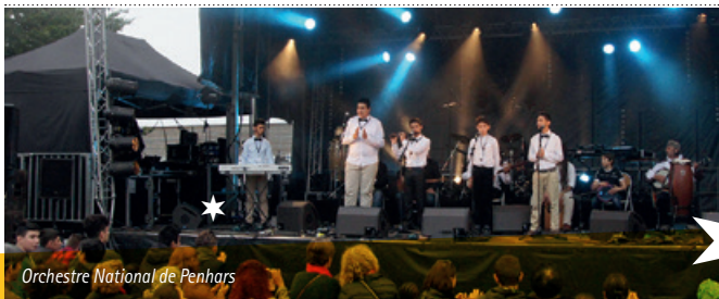
Orchestre National de Penhars

Après avoir fait leur grande première sur la scène de la Rue est vers l'art en 2016, l'orchestre national de Penhars a bien grandi ! Ces musiciens issus du quartier rassembleront les foules autour des airs de musique bretonnes, orientales et turques.