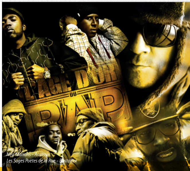
Nég'Marrons - Assassin Les Sages Poètes de la Rue - Bustaflex

On ne présente plus Assassin , pionnier en la matière, oui pour nous il revient, Bustaflex et son job à plein temps, on fera aussi le bilan avec les Nég'Marrons et on saura enfin ce qui fait marcher les Sages Pô . Un beau clin d'œil à l'histoire de cette soirée Hip Hop du Festival REVA qui a su traverser les décennies.