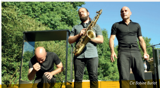
Cie Bobine Burlat

Concoctée avec une grande gourmandise de mots et d'images, Au Fil des Cailloux est une soupe d'histoire "aux p'tits oignons" pour des êtres humains en pleine croissance. Une comédienne riche en vitamines vous embarque pour une balade l'air de rien au fil de l'imaginaire.