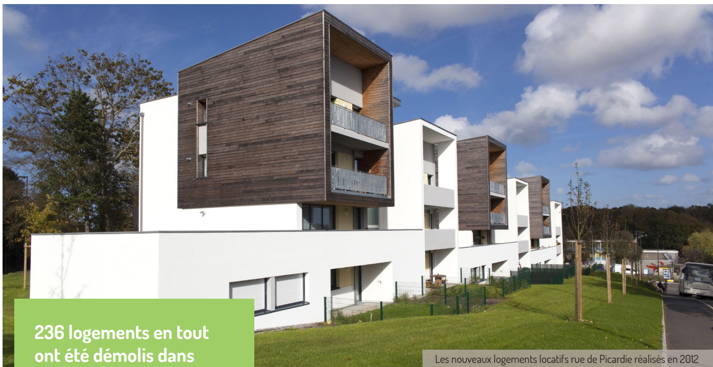
Les nouveaux logements locatifs rue de Picardie réalisés en 2012

236 logements en tout ont été démolis dans l'îlot Vendée / Picardie. Ils ont laissé place à des logements locatifs neufs mais aussi des maisons individuelles en accession sociale à la propriété.