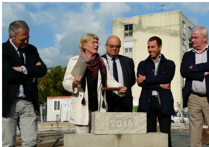
Pose de la 1ère pierre du Pôle Santé le 5 octobre dernier. En plus des professionnels de santé le bâtiment abritera 15 logements aux loyers minorés. Cette opération marquera l'achèvement du « cœur de quartier ».