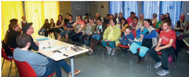
Réunion de bénévoles - La Rue Est Vers l'Art 2016 - Photo : MPT/FR

SI VOUS VOULEZ DEVENIR BÉNÉVOLE, CONTACTEZ LA MPT AU 02 98 55 20 61.