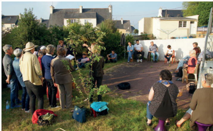
Spectacle chez l'habitant : l'Orchestre National de Penhars et Si On Chantait ! - La Rue Est Vers l'Art 2016

www.facebook.com/localmusik - www.mptpenhars.com