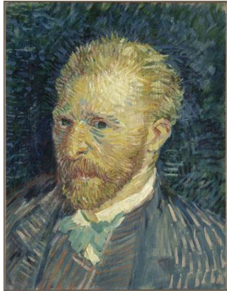
4 Portrait de l'artiste