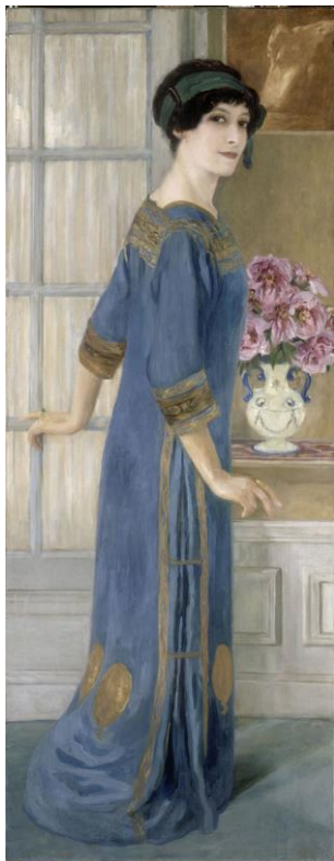
5 Portrait de l'artiste