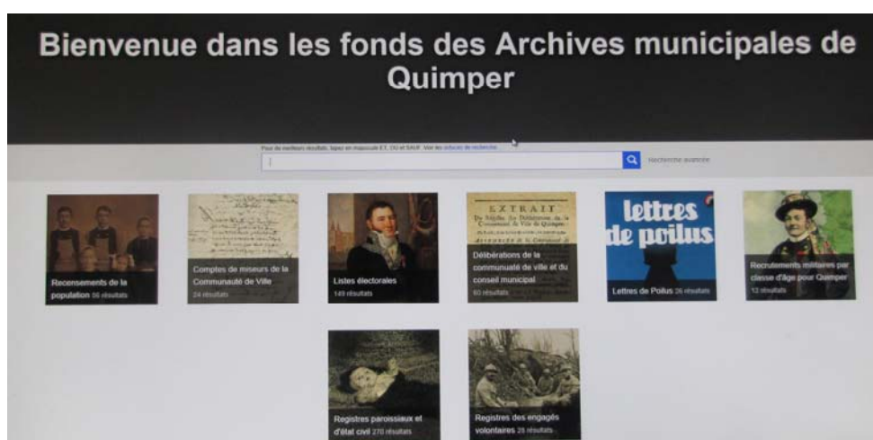
Page du site des archives municipales d'accès aux formulaires de recherches (fonds d'archives en ligne)