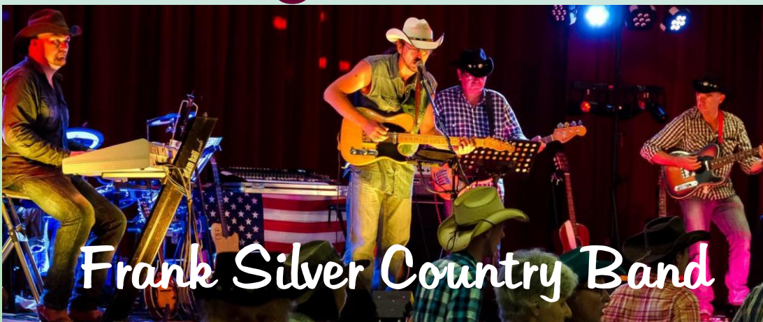
Frank Silver Country Band

Journée: 18€ Bal-Concert: 15€ Tarifs réduits sur réservations Buvette Apéro offert 19/20h auberge espagnole