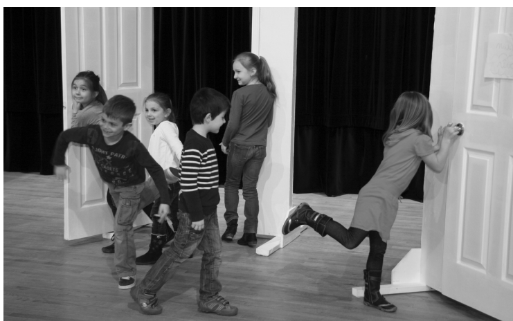
Mise en jeu des intentions et des regards