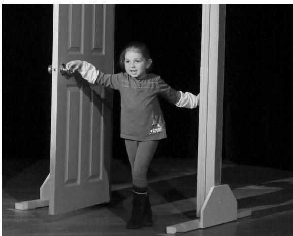
Mise en jeu des corps

Exploration de son corps, de sa voix, de la notion de partenaire, de l'espace scénique, de l'espace de jeu, de l'échange avec le spectateur.