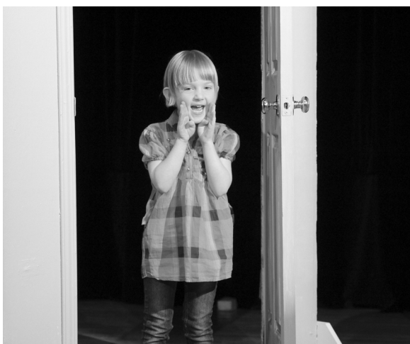
Mise en jeu de la voix