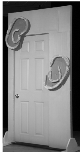
Porte transformation, porte nuage, porte oreilles...

Chez les ados, lors d'un exercice d'exploration sensorielle, chaque comédienne, yeux clos, reçoit un petit « objet » dans la main.