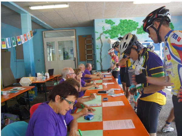
Contrôle secret à Saint Nicolas du Pélem

Nous vous donnons rendez-vous dans 4 ans. Nous aurons besoin de nouveaux bénévoles.