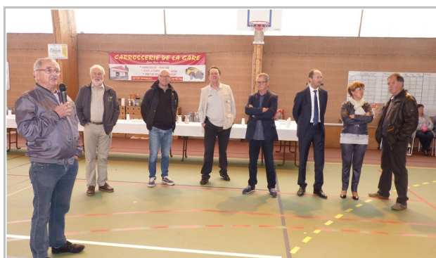
Discours des personnalités