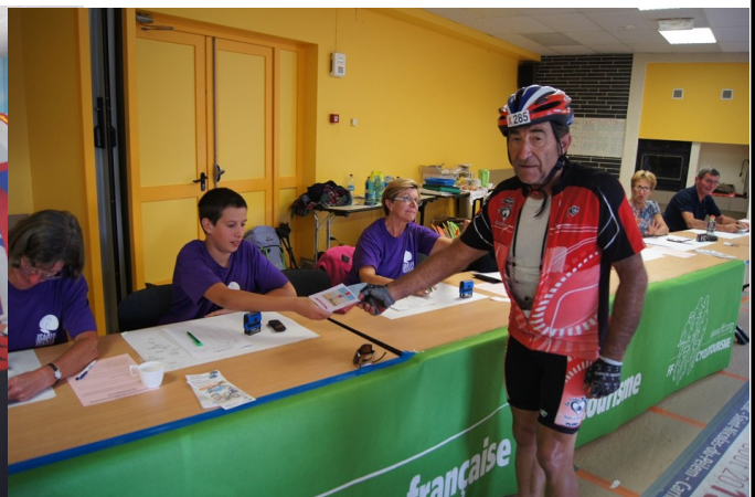
Contrôle secret à Maël Carhaix