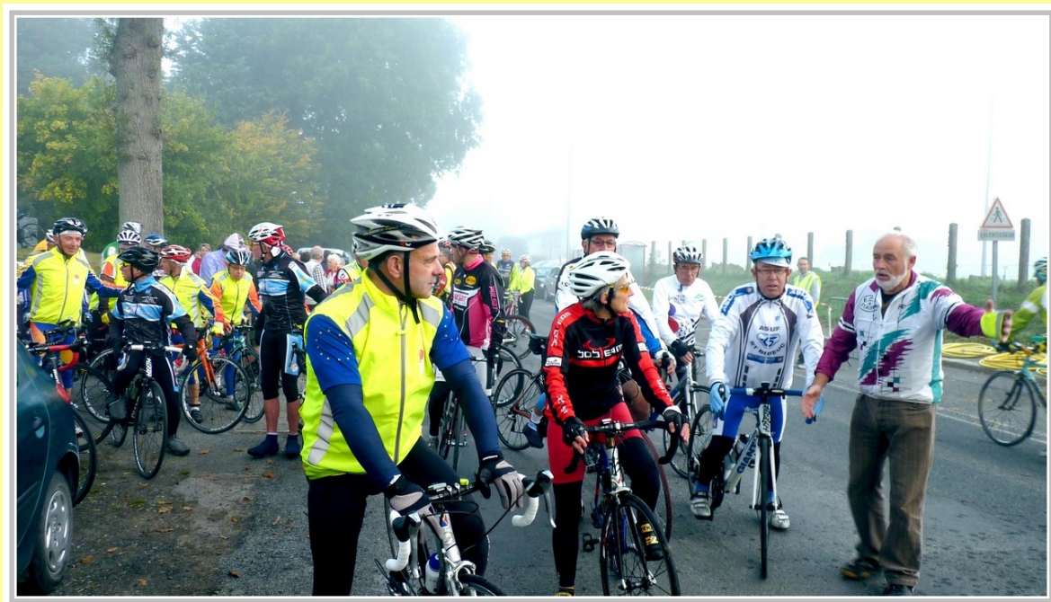
LA CYCL'ARMOR À POMMERET