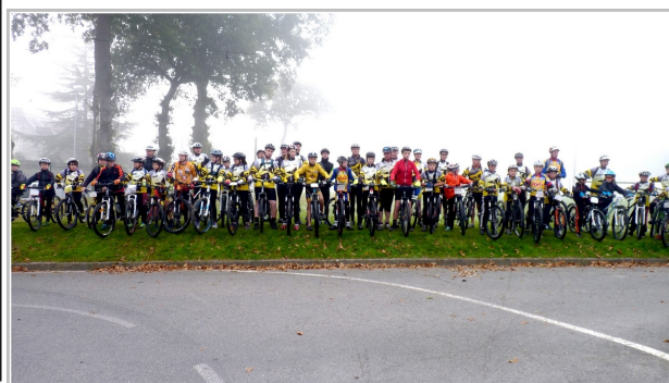
Départ des VTT