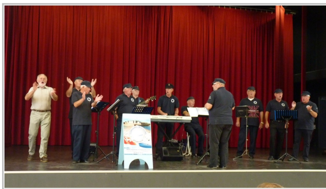
« Les corsaires Malouins »