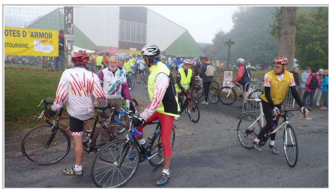
Départ de la route