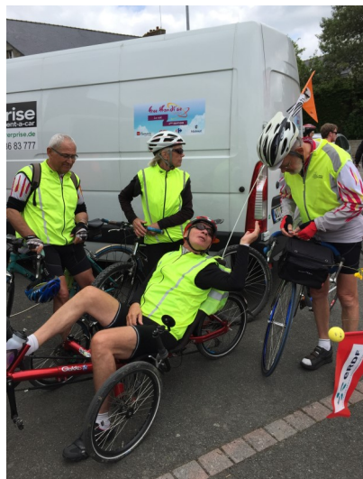
Des cyclos de Lamballe les attendaient à Morieux

Le soir, camping en tentes individuelles