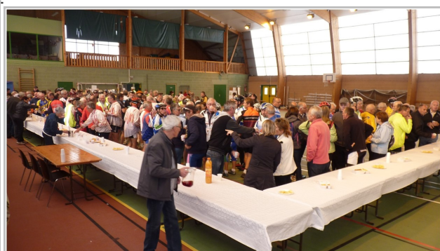
Le pot de l'Amitié