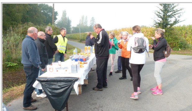
Ravitaillement des marcheurs