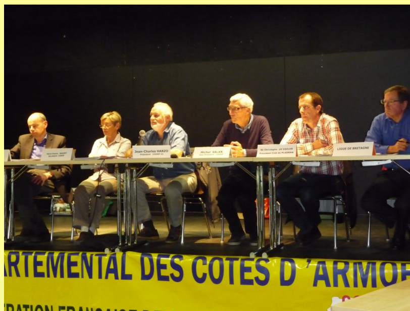
L'AG du CODEP 22 À PLÉDRAN