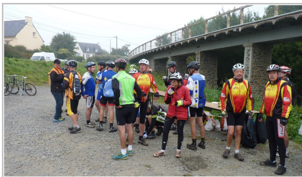
Ravitaillement à HILLION