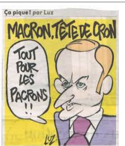
Il suffit de changer de nom !

L'accord de « sauvegarde » de l'emploi où tout le monde a eu le sentiment de se faire avoir arrive à son terme à l'automne 2015.