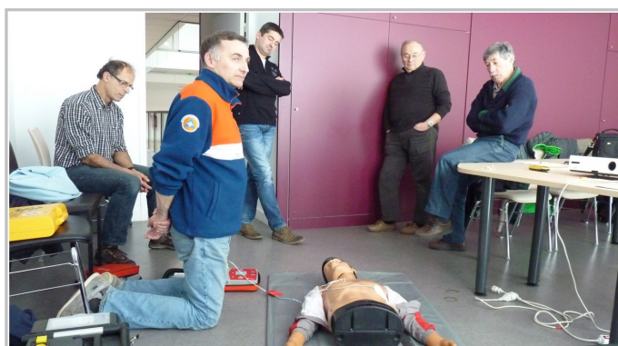
Mise en oeuvre d'une défibrillation