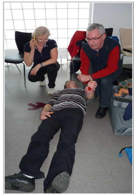
Identifier et agir, mais aussi compression sur l'endroit qui saigne.