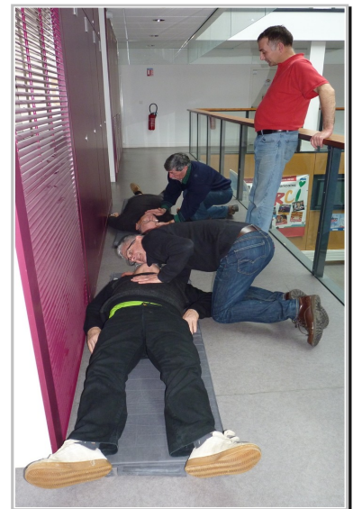
Apprécier la respiration