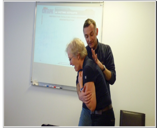
L'obstruction des voies aériennes Claques dans le dos et compression abdominales