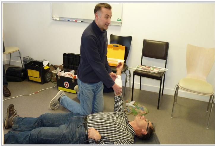
Les hémorragies externes