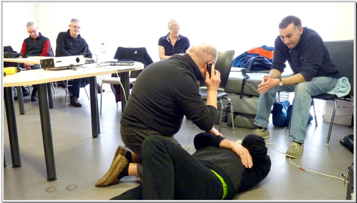
L'alerte des secours

Plusieurs thèmes liés à la prévention et aux secours ont été abordés et mis en situation à l'aide d'exercices pratiques effectués par les participants.