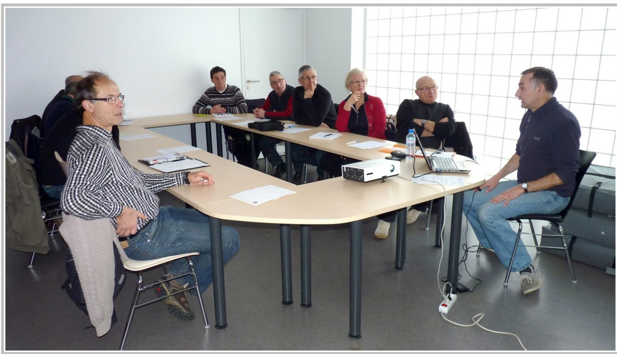
Les participants à la formation

La formation a été assurée par Monsieur Bretagnolle Olivier , formateur à la Protection Civile départementale.