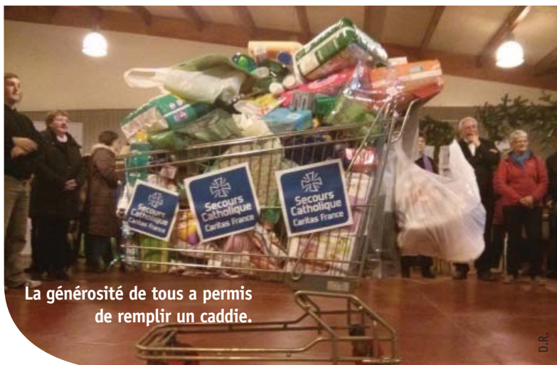
La générosité de tous a permis de remplir un caddie.

Se retrouver pour un vrai moment de partage