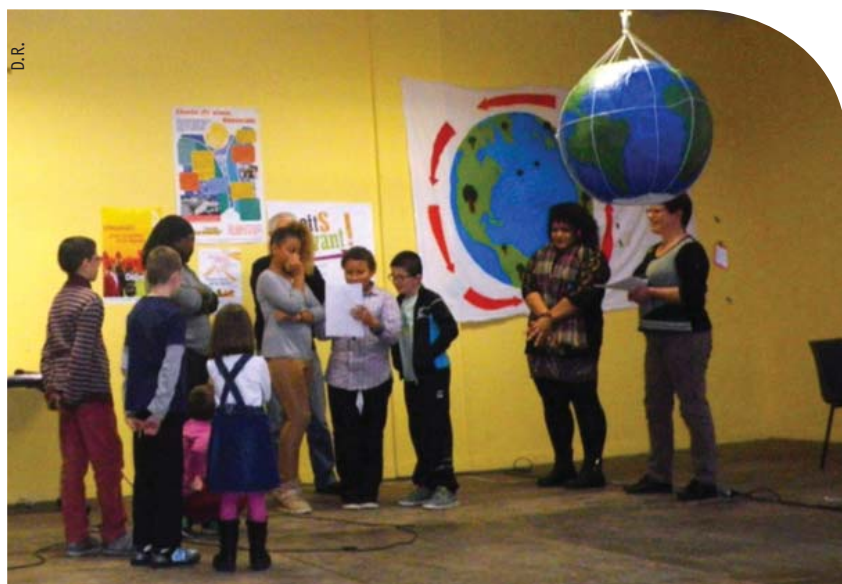
Rencontre en CDMO, Aisne.