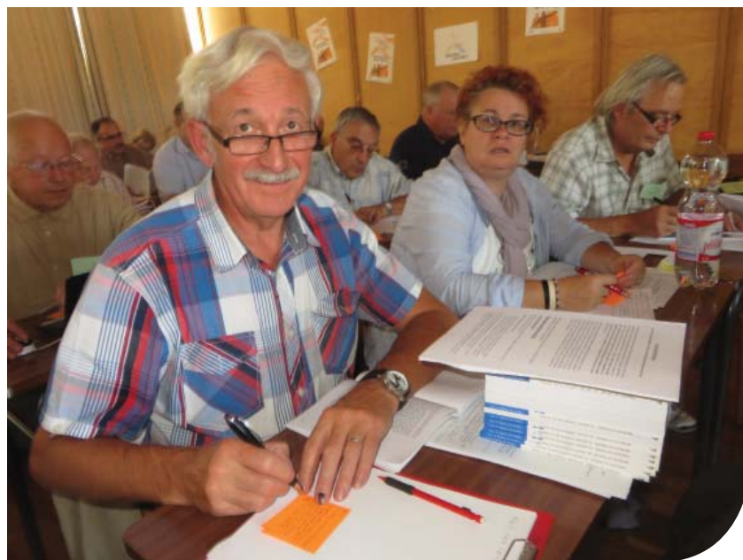
Session des délégués diocésains à la Mission ouvrière (DDMO), septembre 2014.