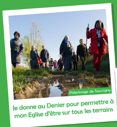
Pèlerinage de Souvigny

Je donne au Denier pour permettre à mon Eglise d'être sur tous les terrains