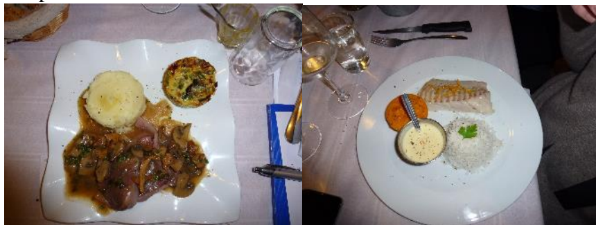
Roti de Cerf Petits légumes Dos de Cabillaud, riz flan de carotte

Merci à Fabrice d'avoir pu nous trouver une solution de remplacement. Menu du soir :