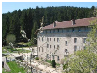
N. D. de l'Hermitage A Noirétable Altitude : 1100 Mètres

3ème Dimanche du mois, 10h à l'église jusqu'à la Toussaint, ou à la Chapelle jusqu'à Pâques.