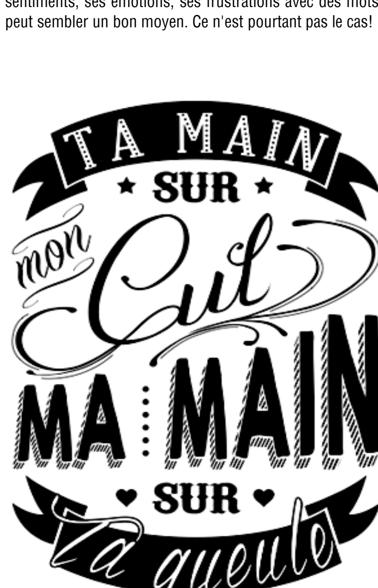
Illustration Laura Association "Colère : nom féminin"

C'est lorsque quelqu'un utilise sa force physique pour dominer ou contrôler l'autre. Les violences physiques sont souvent liées à une difficulté à dire ce qui ne va pas. Lorsque c'est pénible d'exprimer ses sentiments, ses émotions, ses frustrations avec des mots, utiliser sa force physique pour être entendu peut sembler un bon moyen. Ce n'est pourtant pas le cas!