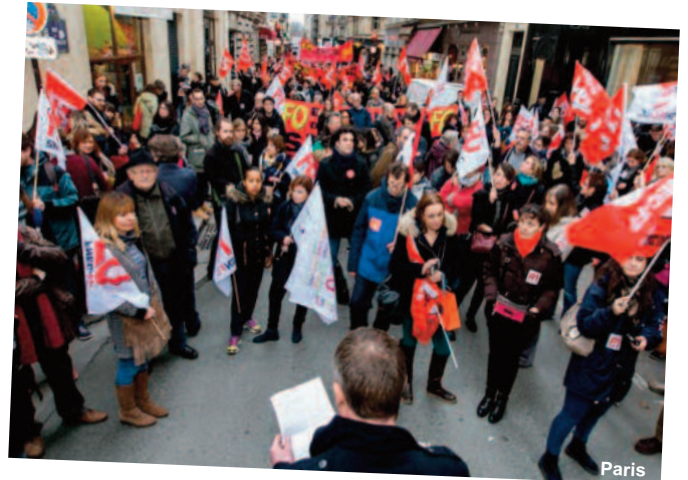
Rassemblements le 1 er février 2017 dans le cadre de l'appel national FNEC-FP FO/ CGT Educ'action / SUD Education à se rassembler devant les DSDEN et rectorats pour l'abandon du projet de décret sur l'évaluation des enseignants.