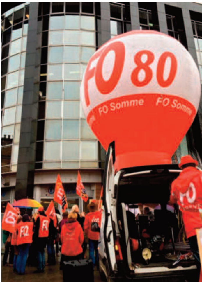
Rassemblement le 1 er février 2017 à Amiens dans le cadre de l'appel national FNEC-FP FO/ CGT Educ'action / SUD Education à se rassembler devant les DSDEN et rectorats pour l'abandon du projet de décret sur l'évaluation des enseignants.