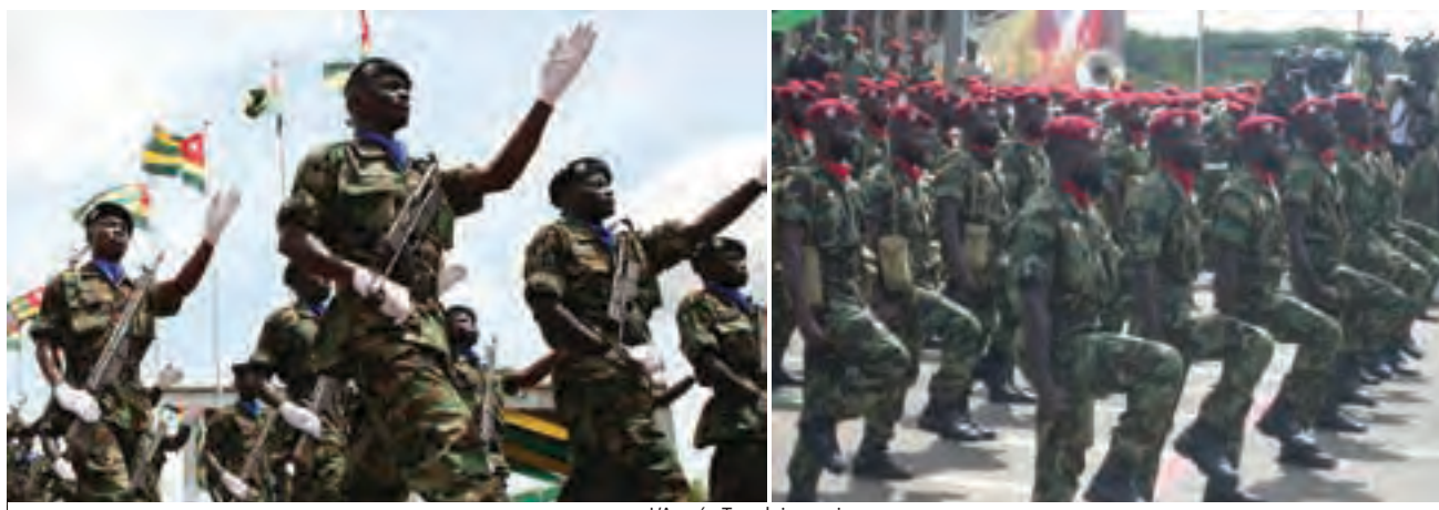
L'Armée Togolaise en image

Les diplomates ont pour leur part des analyses parfois divergentes. Pour l'un, « l'armée togolaise s'est fortement professionnalisée et est plus disciplinée ». Pour un autre, « le poids informel des militaires demeure important : le président est toujours accompagné, où qu'il aille, de nombreux militaires en plus de ses conseillers.