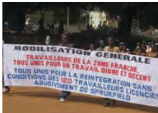
Une mobilisation sociale des travailleurs dans la zone Franche

Mining d'exploitation de Fer à Bandjéli, celui des enseignants des Ecoles privées laïques et confessionnelles, celui des travailleurs de certaines entreprises de la Zone Franche, notamment celle de fabrication de produits pharmaceutiques (Sprukfield), et d'autres encore, comme WACEM, la Générale Industrie du Togo, INDUPLAST etc