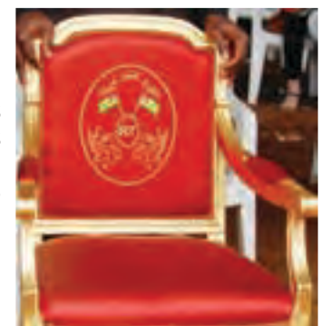
Le Fauteuil présidentiel

Cependant, en cette période préélectorale, la question des réformes est devenue un sujet très sensible (voir infra)