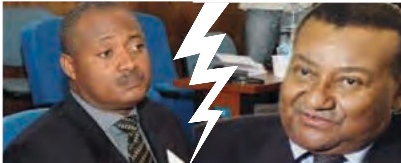
Jean-Pierre FABRE ANC / Gilchrist OLYMPIO UFC

Les dissensions entre les AGO (Amis de Gilchrist Olympio) et les Pro Fabre sont allées très loin, amenant ces derniers à créer l'Alliance Nationale pour le Changement (ANC). La suite de la crise se déroule à l'Assemblée nationale.