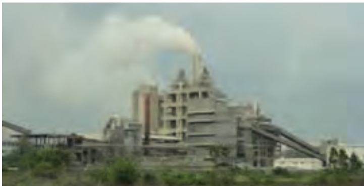
La cimenterie WACEM à Tabligbo à 88 km de Lomé

En 2014, des organisations de la société civile et syndicales notaient que, sur le plan social, malgré des signes palpables d'amélioration des conditions de vie et de travail dans certains secteurs vulnérables notamment la Zone franche, la mise en application des nouvelles dispositions se heurte encore à la résistance des employeurs. En ce qui concerne le secteur minier, le gouvernement peine à prendre des engagements fermes sur la responsabilité sociale des entreprises : les cas les plus traumatisants sont ceux des travailleurs de l'entreprise MM