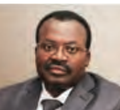
Prem. Ministre AHOOMEY-ZUNU

Une organisation de la société civile, qui, par tradition a une posture très critique envers le pouvoir, décrit de façon très précise la manière dont elle perçoit le pouvoir togolais. Pour elle, le pouvoir est organisé autour de trois cercles :