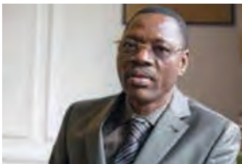
L'ex Président de la CNDH, Koffi Kounté en exil en France

La CNDH, créée en 1987, a été mise en conformité avec les Principes de Paris en 2005 : garanties d'indépendance ; possibilité de s'autosaisir et d'enquêter sur toutes les formes de violations des droits de l'homme commises sur le territoire togolais ; possibilité pour toute personne ou organisation non gouvernementale de saisir la commission.