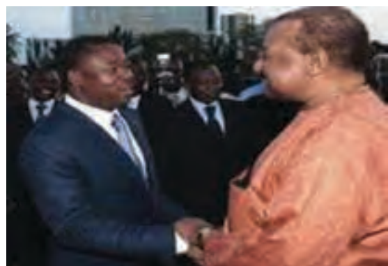
Poignée de main Faure GNASSINGBE et Gilchrist OLYMPIO

Silencieux après le scrutin présidentiel du 4 mars 2010 remporté par son rival Faure Gnassingbé, Gilchrist Olympio, président de l'UFC, à la surprise de nombreux Togolais, signe le 26 mai 2010 un accord de partage des portefeuilles ministériels avec le RPT. Une partie des membres de son bureau exécutif ne partage pas sa démarche et se désolidarise. Un bras de fer est enclenché conduisant à la scission du parti. L'ANC verra le jour le 10 octobre 2010 avec à sa tête Jean-Pierre Fabre. L'accord RPT/UFC prévoyait également la participation de l'UFC au sein des grandes administrations, des sociétés d'état, des préfectures, des mairies et des ambassades, et devait être impliquée dans les réformes institutionnelles et constitutionnelles, l'établissement d'un nouveau fichier électoral. S'il est vrai que nous sommes dans l'incapacité de dire si l'UFC participe véritablement ou effectivement à la gestion