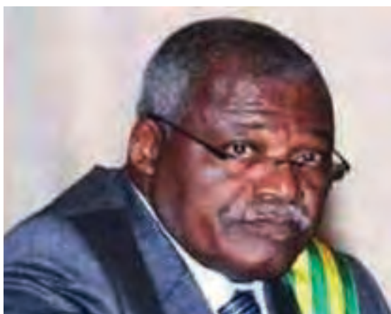
Abass BONFO Ex Président de l'Assemblée Nationale

Selon le CAR, l'UNIR est en position dominante au parlement et ne tolère aucune contestation « On a terrorisé notre député parce qu'il interpellait un Ministre (avril 2014) et l'UNIR n'a aucune culture de dialogue et de négociation ; l'UNIR n'a pas laissé de poste à l'opposition au sein du Bureau du Parlement ». L'ANC confirme cette posture : « On a posé 17 questions, on a eu zéro réponse (...) On est à l'Assemblée nationale, mais c'est sur le papier. A la Conférence des Présidents, tout se décide à la majorité absolue ». Un diplomate confirme : « l'Etat togolais n'est pas habitué à être critiqué, même de manière constructive ».