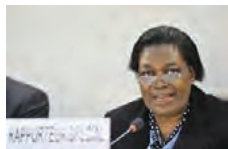
Margaret SEKAGGYA, Rapporteuse spéciale des Nations Unies

En janvier 2008, le Rapporteur spécial des Nations unies sur la torture a noté dans son rapport que les autorités togolaises s'étaient engagées à lutter contre la torture. Dans la plupart des postes de police et des gendarmeries dans lesquels il s'était rendu, il avait toutefois constaté des preuves de mauvais traitements, infligés par des agents de la force publique à des suspects au cours d'interrogatoires. Il a également relevé des cas de passages à tabac pratiqués par des gardiens de prison à titre de sanction.