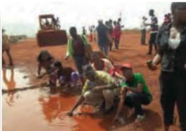
L'eau impure de Bangeli