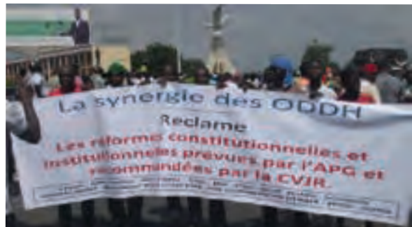
Marche des ODDH pour les réformes

De son côté, le GRAD a publié un mémorandum réclamant la mise en place d'une assemblée constituante avant même de tenter d'organiser des élections libres et transparentes. Pour le GRAD, cette solution permettrait de s'attaquer aux sources réelles de la crise togolaise. Selon le GRAD, la recherche du consensus devrait fonder cette transition politique, en impliquant notamment les partis politiques et la société civile. Le GRAD estime aussi que la nomination des membres du gouvernement, les prérogatives du chef de l'Etat, la forme juridique des engagements etc. devraient faire l'objet d'un consensus et être assortis de sanctions pour tous ceux qui ne respecteraient pas les clauses de cet accord. Cette approche était aussi censée contribuer à privilégier les changements politiques et constitutionnels dans un esprit d'apaisement. Cette forme de transition politique