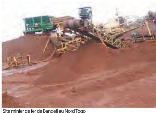
Site minier de fer de Bangeli au Nord Togo

Mining d'exploitation de Fer à Bandjéli, celui des enseignants des Ecoles privées laïques et confessionnelles, celui des travailleurs de certaines entreprises de la Zone Franche, notamment celle de fabrication de produits pharmaceutiques (Sprukfield), et d'autres encore, comme WACEM, la Générale Industrie du Togo, INDUPLAST etc