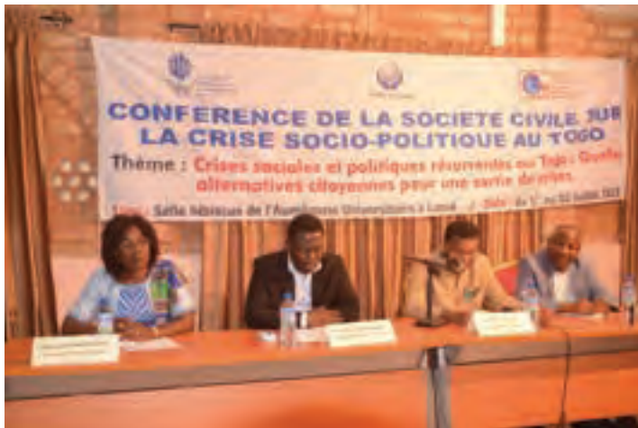
Table de présidence 1ère Conférence de la société civile sur les crises sociales et politiques récurrentes au Togo

Pourtant, à l'initiative notamment de plusieurs organisations de la société civile telles que la LTDH, l'ACAT ou d'autres, un dialogue a pu s'instaurer en début février 2006, permettant des discussions directes avec le gouvernement, le président de la République et la société civile. Ainsi, à la suite de plusieurs missions de la FIDH et de la LTDH, 18 l'action de l'ACAT et bien d'autres organisations (GRAD, GF2D, SADD), les grandes lignes d'un processus en vue de créer une Commission vérité, justice et réconciliation (CVJR) 19 sont discutées ; la peine de mort est finalement abolie, la Commission nationale des droits de l'Homme est réformée, etc. D'abord peu favorables à de tels «cadeaux» faits au pouvoir, les partis politiques ont levé leur opposition sur ces questions, voire collaboré à leur mise en œuvre.