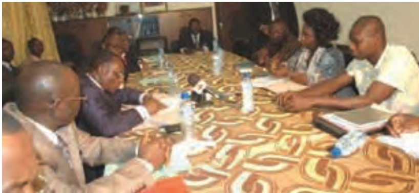
La STT en négociation avec le gouvernement

Au regard des insuffisances en matière de droits économiques sociaux et culturels, les organisations syndicales togolaises ont réussi à obtenir du gouvernement et du patronat un dialogue social. Ce dernier a duré trois mois et a abouti, le 11 mai 2006, à la signature d'un protocole d'accord dans lequel les trois parties ont pris 125 engagements assortis d'un chronogramme d'application étalé sur trois ans. Ces engagements couvrent tous les secteurs de l'économie nationale et visent à remédier durablement à la situation de crise sociale qui prévaut au