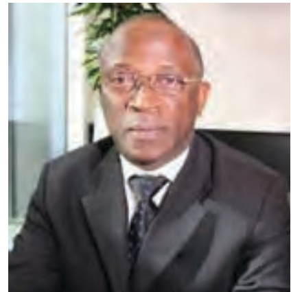
Me APEVON Président du CAR

Pour le CAR, « il y a un vrai problème de confiance entre gouvernés et gouvernants. Les Togolais ont le sentiment de ne pas être égaux devant les biens publics de l'Etat. En terme de réconciliation, les Togolais ne voient pas de changements de comportement des dirigeants ». Et d'ajouter : « il y a une désillusion du public et des cadres/forces vives envers le politique, lorsque ceux-ci se sont rendus compte qu'on passait d'une course de vitesse à une course de fond (...) Les cadres sont usés/découragés et la jeunesse ne se mobilise pas et n'a pas la volonté de se sacrifier comme leurs aînés qui vivent dans la pauvreté. Les élites ne vont plus vers les partis politiques ».