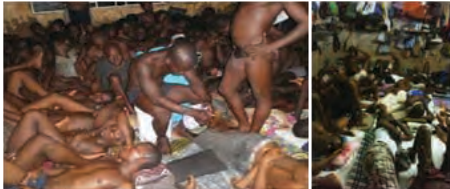
La surpopulation carcérale à la prison civile de Lomé