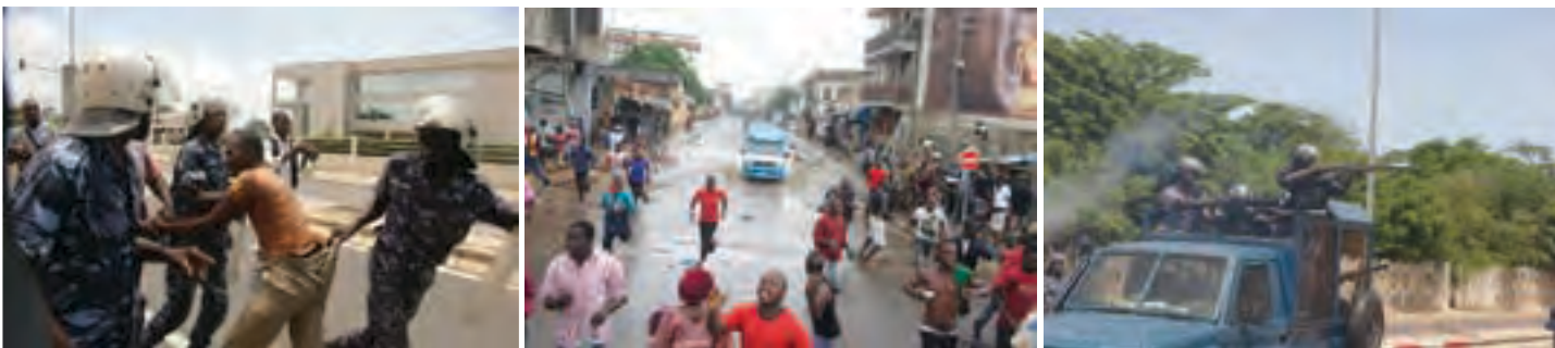
Répression des manifestants de l'ANC à Lomé

Seule l'ANC semble faire actuellement l'objet, au Togo, d'une politique de harcèlement continu de la part du pouvoir en place : intimidations et menaces contre des personnes impliquées dans des manifestations/rassemblements de l'ANC dans le Nord du pays ; répression de manifestations à Lomé, par des milices proches de l'UNIR et harcèlement judiciaire des principaux dirigeants de l'ANC dans l'Affaire des incendies de Kara et de Lomé (janvier 2013).