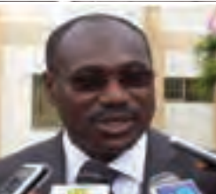
Min des droits de l'homme Y. AMADOU