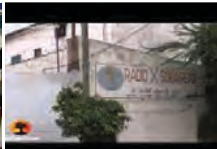
Radio x-solaire fermée par la HAAC