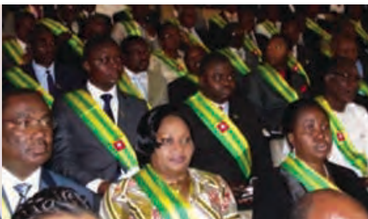
Les parlementaires en séance plénière