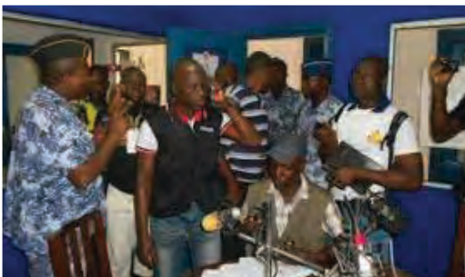
Radio Légende FM envahie par les forces de l'ordre