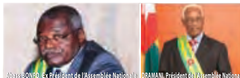
Abass BONFO, Ex Président de l'Assemblée Nationale