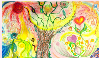
Œuvre collective juin 16

Déroulement des séances : La 1ère heure nous prépare avec la gym holistique et/ou la méditation en lien avec le thème de la séance. Arrive ensuite la danse avec musiques variées du monde. Les séances sont à la portée de tous et aucun bagage en danse n'est nécessaire.