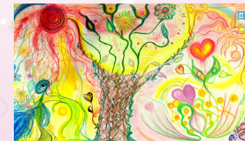
Œuvre collective juin 16

Déroulement des séances : La 1ère heure nous prépare avec la gym holistique et/ou la méditation en lien avec le thème de la séance. Arrive ensuite la danse avec musiques variées du monde. Les séances sont à la portée de tous et aucun bagage en danse n'est nécessaire.