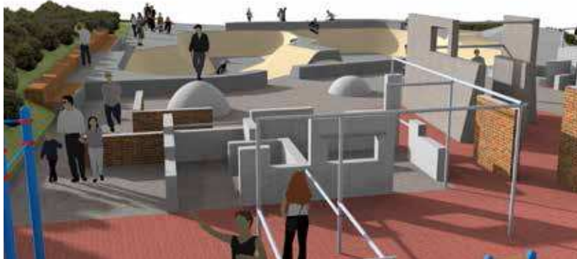
Perspective d'architecte réalisée par le cabinet Ingé-Infra

PARKOUR Popularisé par le film Yamakasi , le parkour (art du déplacement urbain) est une discipline qui ne cesse de se développer. Dans le cadre de sa politique de la jeunesse, Equeurdreville-Hainneville a mis en place avec les ados de multiples actions : création du Conseil de la jeunesse et de juniors-associations, activités et médiation jeunesse, bourses-projets jeunes et développement des pratiques culturelles urbaines, à l'image du festival Escales Urbaines. Près de 600 jeunes participent à ces actions et assurent toute l'année la promotion de pratiques telles que hip-hop, d'jing, BMX, trottinette... Aussi, le