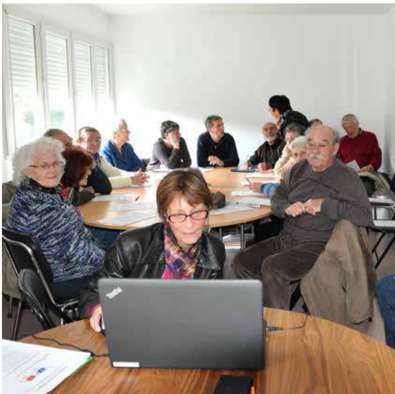
La plateforme de services accompagne les seniors dans leurs démarches et leur vie quotidienne. Sur cette photo : une session d'information sur la réception de la TNT.