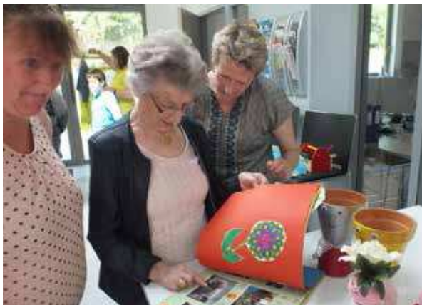
Les enfants du Centre de loisirs ont confectionné des cadeaux pour les résidents de La Chênaie.