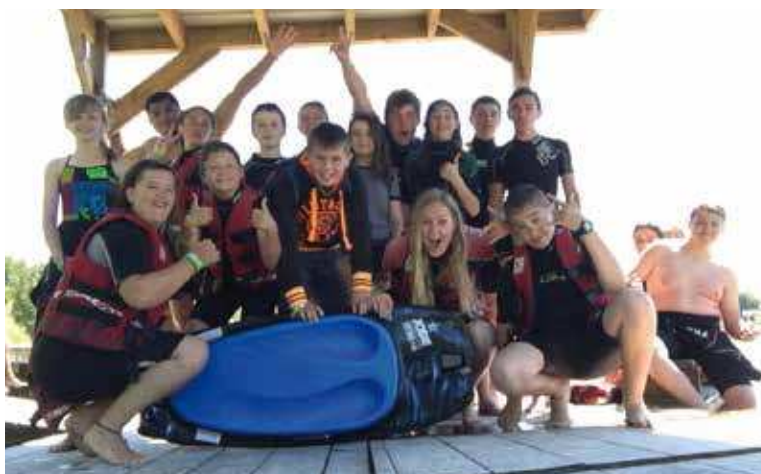
Les jeunes de Querqueville ont pu profiter des sorties et séjours proposés cet été par l'Espace jeunes.

Contact : 02 33 01 06 19 enfance.jeunesse@ville-querqueville.fr