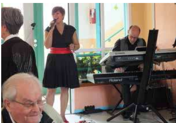
Le groupe Le Petit Voisin a animé l'après-midi, en reprenant des tubes connus des résidents.