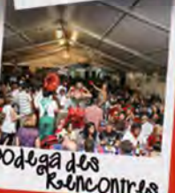
Bodega des Rencontres