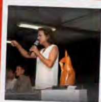
vente aux enchères

00h00 Feu d'Artifice : spectacle pyrosymphonique Prairie Cassagne