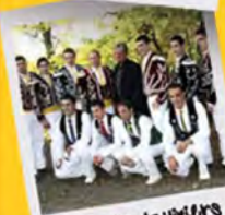
...et ses esquiers