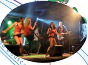
Bal sur les allées, tous les soirs