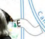
IMPASSE DES TANNERIES