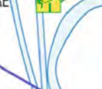
IMPASSE DES TANNERIES