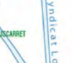
ALLEE DU PARC DES SPORTS