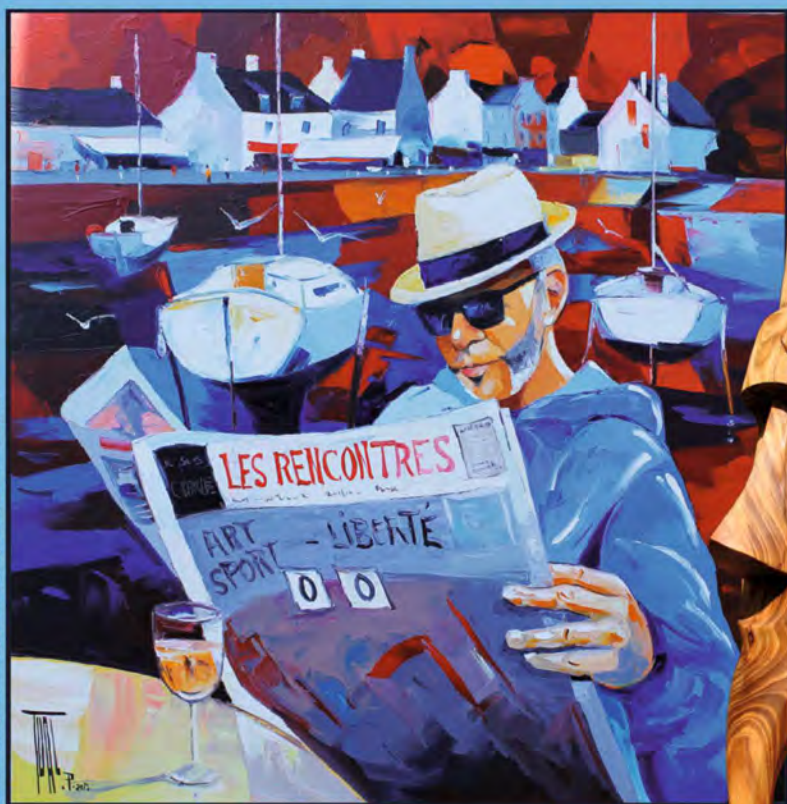
Pierrick TUAL, «Liberté», 90 x 90 cm, huile sur toile, 2015