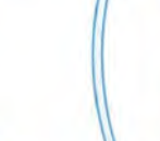
ALLEE DU PARC DES SPORTS