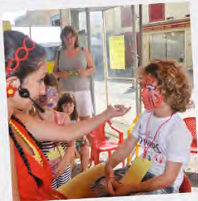
Fiesta des Pitchouns