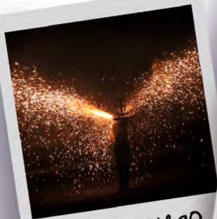
TORO de FUEGO