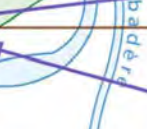
ALLEE DU PARC DES SPORTS