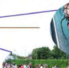
Nautation, Coupe de la Ville vendredi après-midi