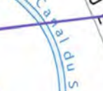
ALLEE DU PARC DES SPORTS