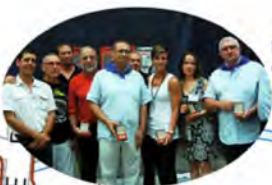
Ouverture vendredi à 19 h