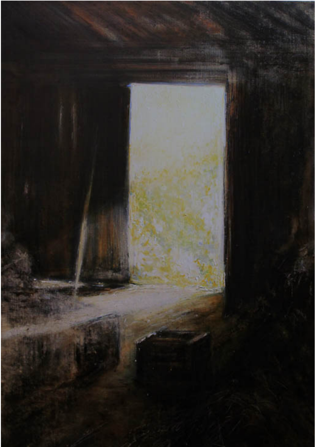
huile sur toile 120x80